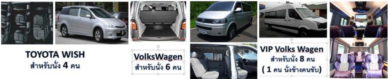
TOYOTA WISH สำหรับนั่ง 4 คน