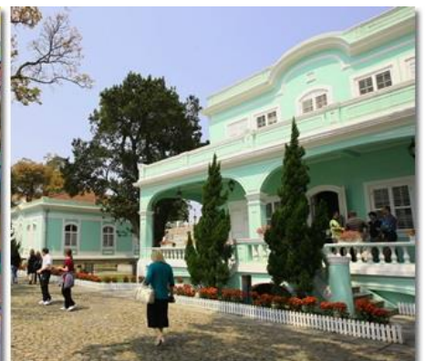
บรรยากาศ หมู่บ้าน เซอร์รา (เซร์ราเลอา) จ.มาเก๊า