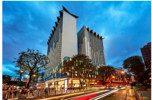
โรงแรม Mandarin Orchard Singapore