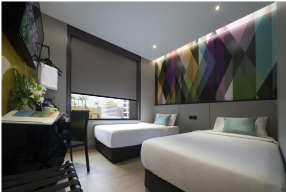
โรงแรม Mi Hotel