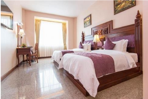
โรงแรม PHNOM PENH ERA HOTEL