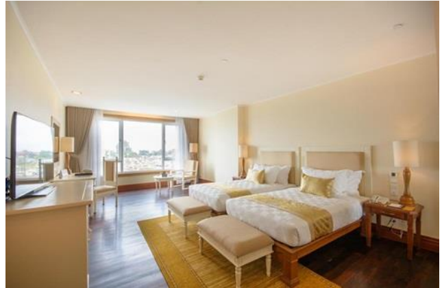
โรงแรม SOKHA PHNOM PENH